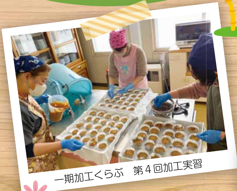
一期加工くらぶ 第4回加工実習